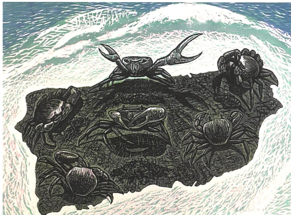
Sobrevivientes , Poli Marichal. Grabado a color en PVC y madera. 2019. Colección Museum of Latin American Art, Long Beach, California.

tenida estructura formal y denso trabajo en la construcción figurativa del cuerpo, con imágenes de intensa belleza y pautado desarrollo narrativo. La salida supone un nuevo hito en el periplo personal, cuya lógica interior afirma un sujeto reflexivo, sensorial, asido al tiempo, que dibuja el amor y el deseo como ineludibles topografías de lo paradójico.