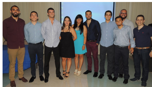
Estudiantes Atletas que Culminan sus 4 Años LAI