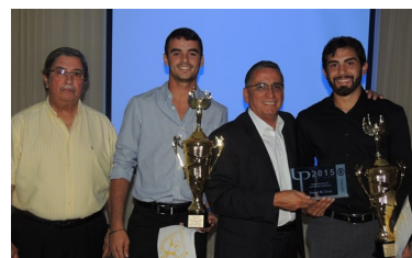
Voleibol de Playa, Ambos Mas Valiosos