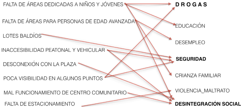
Imagen 7. Diagrama de necesidades del barrio.

gocios. La reunión se basaría en diferentes dinámicas de integración y llenar un cuestionario. A esta primera reunión, solo asistieron tres (3) personas. Por lo tanto, el equipo de trabajo fue directamente a los hogares a llenar los cuestionarios y promocionar una segunda reunión. De este proceso, se logró hacer contacto con quince (15) personas que accedieron a llenar el cuestionario. Con esta información, se identificaron problemas sociales y físicos, posibles programaciones e ideas de espacios públicos dentro del barrio.