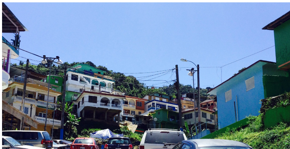
Imagen 9. Condición de estacionamiento en El Cerro, Naranjito, Puerto Rico.

«Sin embargo, estas escaleras son espacios comunes, conectores existentes en el tejido del barrio. Por lo tanto, son el escenario de los potenciales encuentros comunes dentro del vecindario, y se pueden intervenir para fomentar la interacción social de la que hablaba Rapoport (la comunicación social como necesidad básica).»