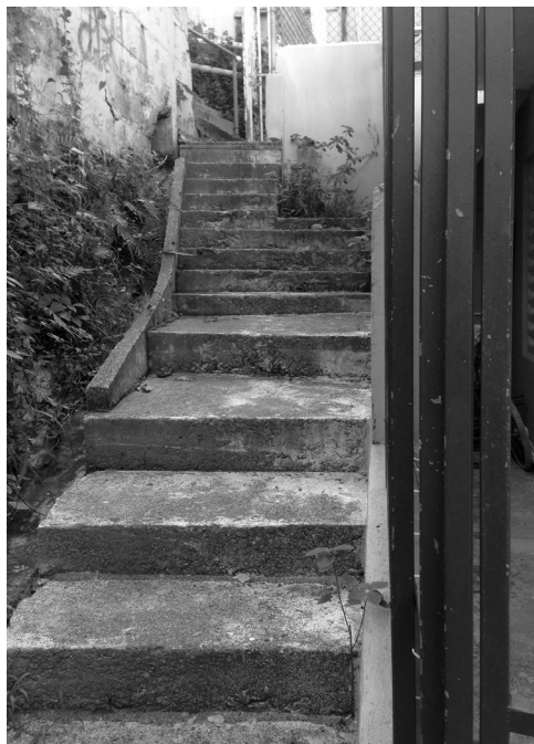
Imagen 10.1 y 10.2. Estado de las escaleras comunes utilizadas por los residentes de El Cerro. (Foto: BVOM).

estacionarlo. Parte de la programación propuesta debería integrar un espacio para estacionamiento de residentes de El Cerro.