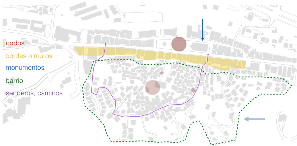
Imagen 8. Diagrama de condiciones en la barriada El Cerro, Naranjito, Puerto Rico. (Fuente: BVOM).

«Existen varias necesidades físicas que repercuten en las socioculturales. La primera es que esta comunidad queda como un paisaje a la espalda del desarrollo económico del pueblo.»