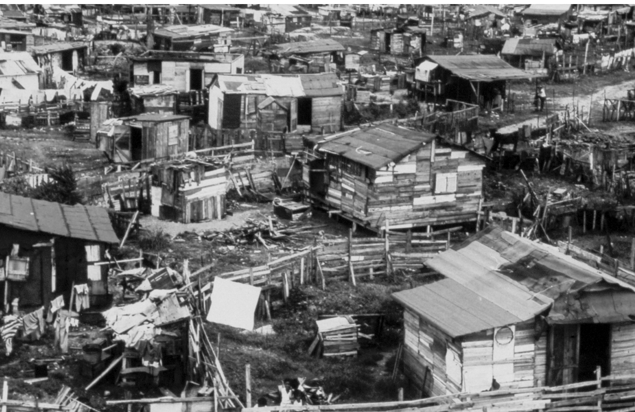
Arriba/Top: Imagen 2. Vivienda en arrabal de la zona capital de la Isla, c. 1950.