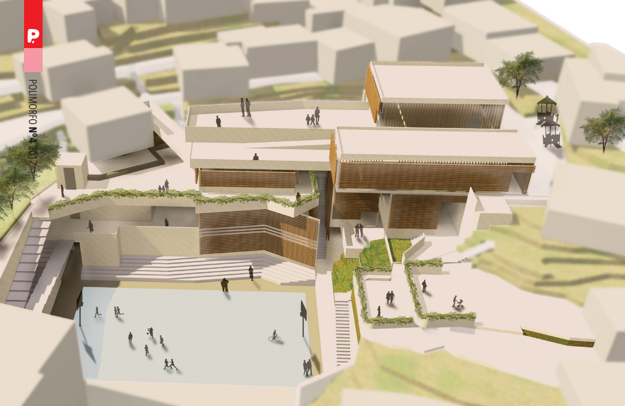
Imagen 14. Vista aérea de la propuesta del centro comunitario del proyecto de Acupuntura Urbana en El Cerro, Naranjito, Puerto Rico.

más privados de los programas. También existirá otro tipo de vegetación que informe a los usuarios sobre la ubicación de espacios públicos y comunes dentro del centro.