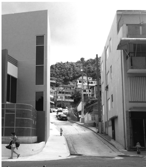
Imagen 5. Segregación entre barriada y el pueblo. (Fuente: BVOM).

tividad como barrio y de su historia como comunidad. Algunos de estos proyectos han consistido en pintar las casas en tonalidades de verde para “devolverle el verde al Cerro” 20 (imagen 6), montar un museo doméstico con objetos cotidianos pero de significado cultural y familiar llamado Museo El Cerro; y una editorial temporera llamada Hangueando: periódico con patas que buscaba desarrollar junto con la comunidad un periódico o panfleto informativo que recopilara experiencias e historias que le interesara dejar documentadas a la comunidad. 21 Este tipo de actividades ha logrado que en más de una ocasión la comunidad se una para lograr algo en conjunto. Ya tienen noción de unirse como comunidad y aceptar gente de afuera que los guíe para trabajar por ellos mismos. Por lo tanto, un proceso de arquitectura participativa no sería una experiencia del todo nueva para esta comunidad. No obstante, ninguno de estos procesos participativos de arte han sido dirigidos al área de la arquitectura o planificación urbana. En el caso de las actividades de arte social, en muy pocas, el aspecto sociocultural se abarca como una mejora pública permanente. Este ejercicio académico busca plantear una solución para ambos problemas (físicos y socioculturales) con intervenciones puntuales de espacio público.