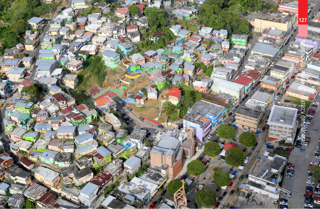
Imagen 6. Vista aérea de barriada y casas participantes del proyecto "devolverle el verde al Cerro".

ficación de necesidades y propuestas de soluciones para su comunidad. A través de estos talleres, se pretende captar el contexto cultural de la comunidad y qué aspectos socioculturales son más evidentes o críticos. El foco de este proceso se basa en conseguir la comunicación e integración social tanto a nivel interno (entre las barriadas) como a nivel regional (relación con el casco urbano), por medio de espacios dedicados al colectivo. Se busca la integración de las cuatro barriadas para presentar soluciones a sus problemas sociales hasta ahora identificados, como lo son: la falta de seguridad, el desempleo y la deserción escolar. Esto, al mismo tiempo, fomenta la iniciativa que ya existe en la comunidad de crear una junta comunitaria de El Cerro. 26 Este proceso persigue la idea de conseguir que El Cerro sea un destino dentro del pueblo y de esa forma lograr la integración a nivel regional. En el aspecto de integración interna, se busca hacer de espacios existentes o lotes vacíos potenciales encuentros comunes que la comunidad identifique dentro del barrio.