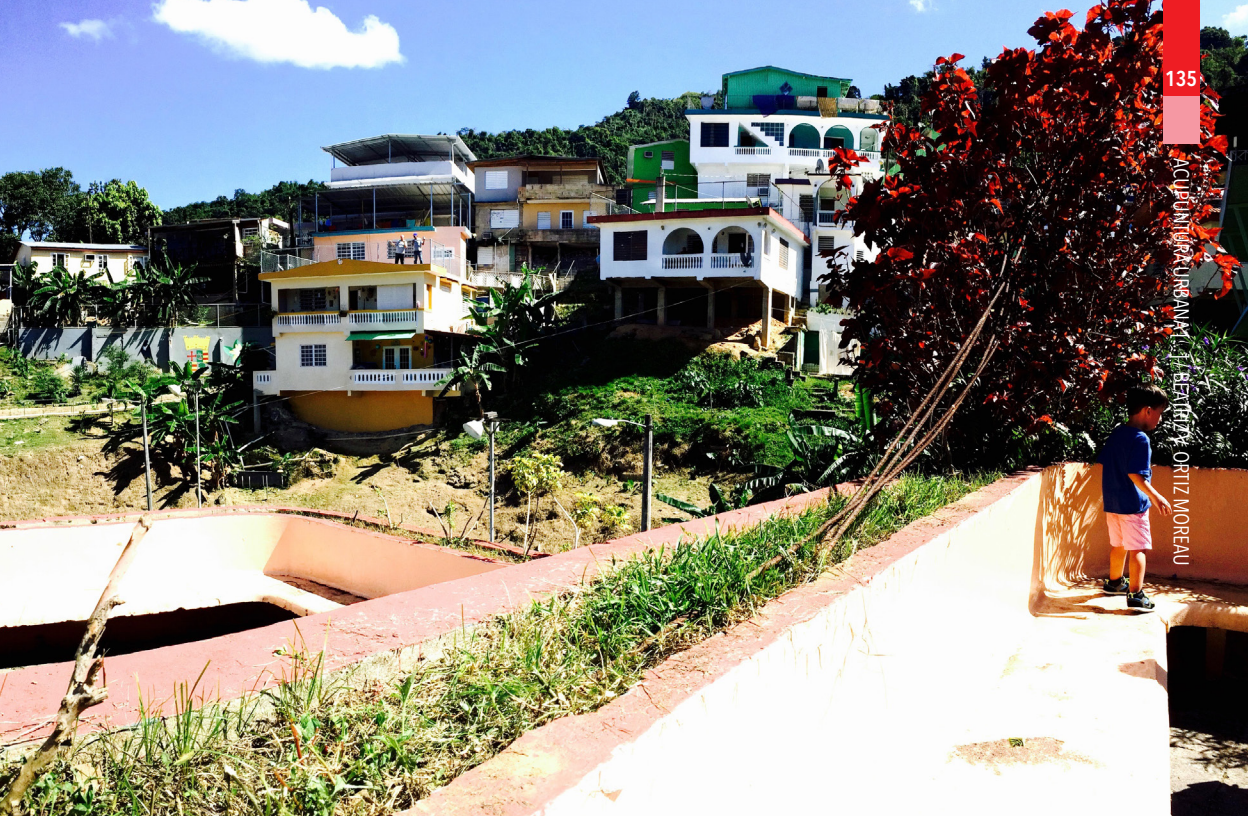
Imagen 12. Vista panorámica de El Cerro, Naranjito, Puerto Rico.

miento y aglomeración 37 de estructuras (residencias) que dejan pocos lugares para nuevos desarrollos más allá de los pequeños lotes vacíos por demoliciones de residencias. 38 Tomando esto en consideración y habiendo entendido el efecto negativo de la falta de lugares públicos en el barrio, una de las preguntas en el cuestionario iba dirigida a la opinión sobre un espacio común o público existente en El Cerro: su Centro Comunitario. La estructura de este centro es parte de la historia del lugar. Empezó como una estructura construida por los mismos residentes hace muchos años atrás. Luego de algunas mejoras, con el tiempo, se convirtió en una clínica de dentistas y salud comunitaria. Al pasar los años, se deterioró y bajo el programa de Comunidades Especiales de la Gobernadora Sila M. Calderón, a petición de los residentes, lo habilitaron para que funcionara como centro comunitario. Es una estructura pequeña, de dos pisos, que cuenta con un salón de actividades arriba y lo que era un centro de cómputos en el primer piso. Actualmente (2014), esta estructura está deteriorada y solo funciona el salón de actividades en el segundo piso.