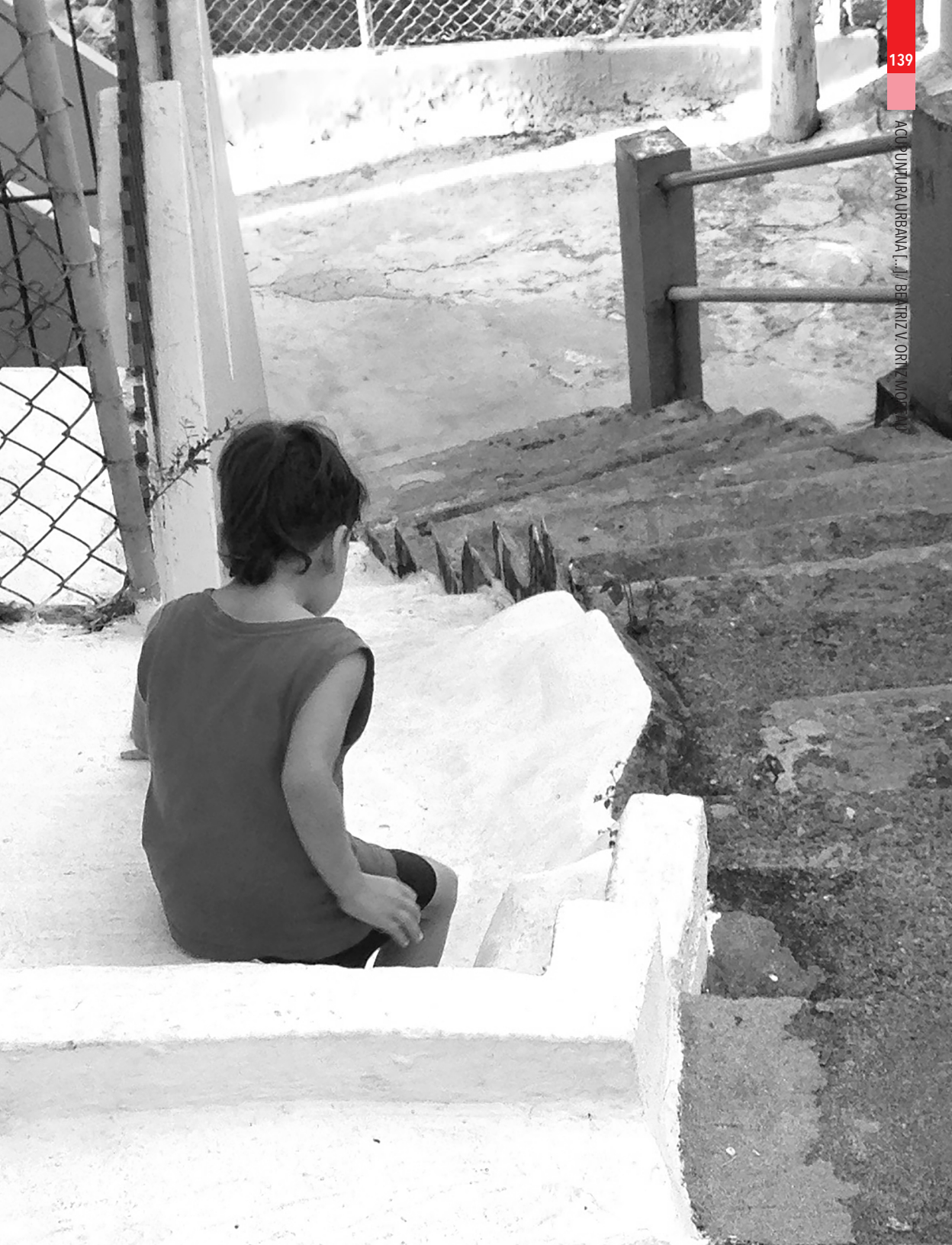
Imagen 13. Área de las escaleras utilizadas como espacio de recreación.