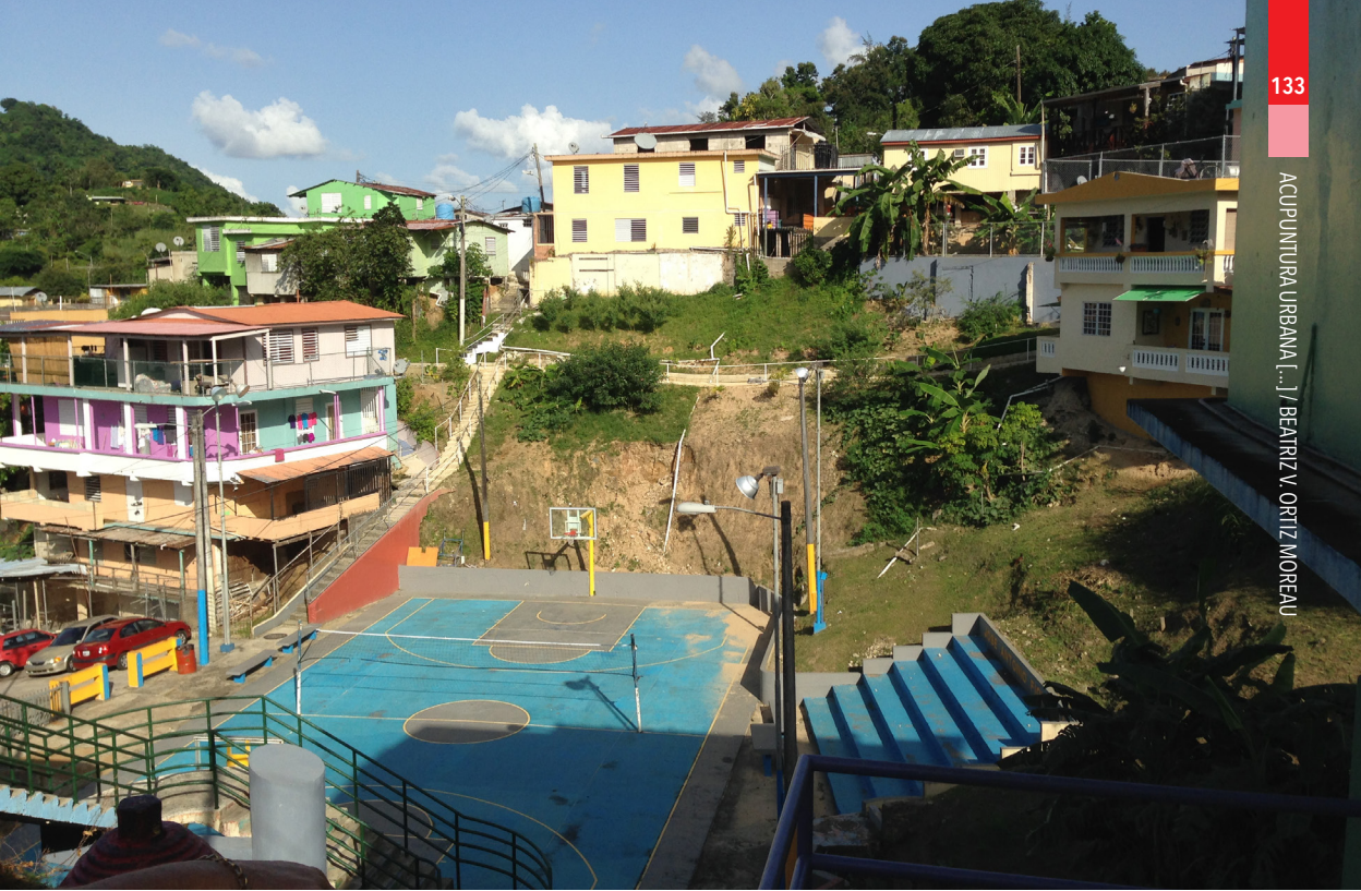
Imagen 11. Vista de la cancha y sus accesos en El Cerro.

fomenta actividades ilícitas y de ocio negativo perjudiciales para niños, jóvenes, adultos y personas de edad avanzada.