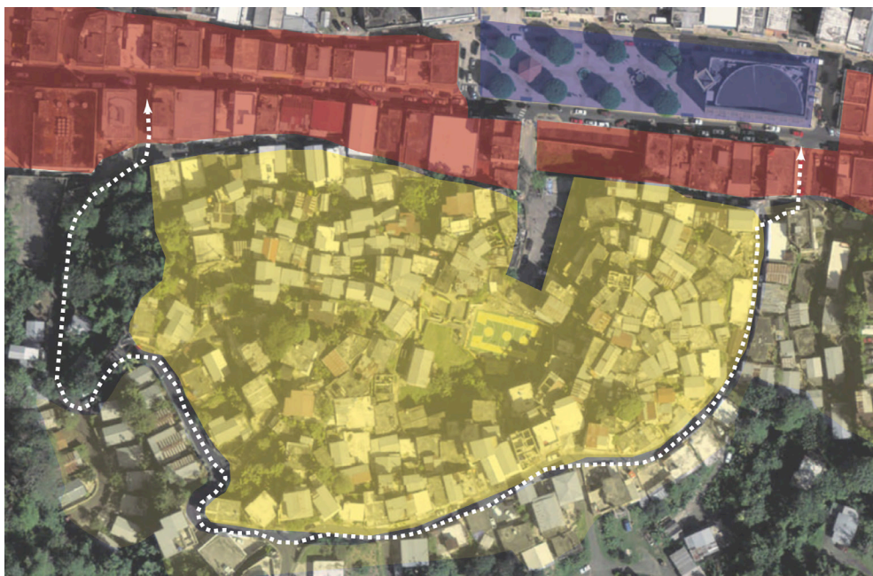
Imagen 4. Diagrama de relación entre casco urbano y Barriada El Cerro en Naranjito, Puerto Rico. (Fuente: BVOM).

inaccesibilidad respecto al centro urbano adyacente y falta de espacios comunes. A la vez, esto repercute en problemas sociales de separación o segregación social por existir una barrera física (de edificios) entre las barriadas y el pueblo (imagen 5). Esto no es tan evidente en las demás comunidades. La conexión de estas, tanto visual como físicamente, están mejor resueltas que en las de Naranjito. Tanto en el caso de El Cerro de Gurabo como en El Cerro de Yauco, existen caminos peatonales y vehiculares formales que conectan al barrio con el casco urbano. Además, estas comunidades tienen establecido un sistema de transporte público funcional para los residentes de la comunidad. La mayor necesidad de los residentes de estos barrios es de carácter individual, el deterioro sus residencias. Por otro lado, El Cerro de Naranjito refleja necesidades colectivas tanto físicas como sociales.