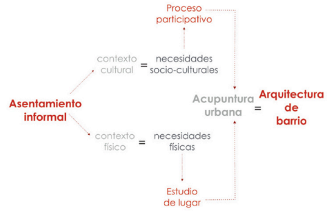
Imagen 1. Diagrama de necesidades del barrio.

Como parte de la hipótesis, es importante entender que estas propuestas deben ser definidas por medio de un diálogo comunitario. Este será establecido a través de un proceso de participación comunitaria. El diseño de este proceso responde a las características del colectivo, su estructura social y dinámicas de interrelación. Este proceso funcionará como una herramienta para poder entender y atender necesidades físicas, pero sobretodo, las socioculturales que la misma comunidad identifica.