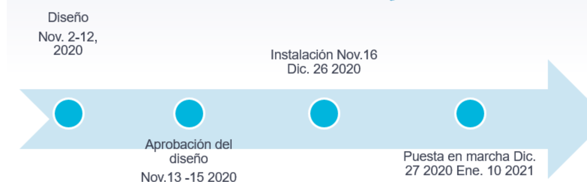
Figura 1 Cronograma del proyecto