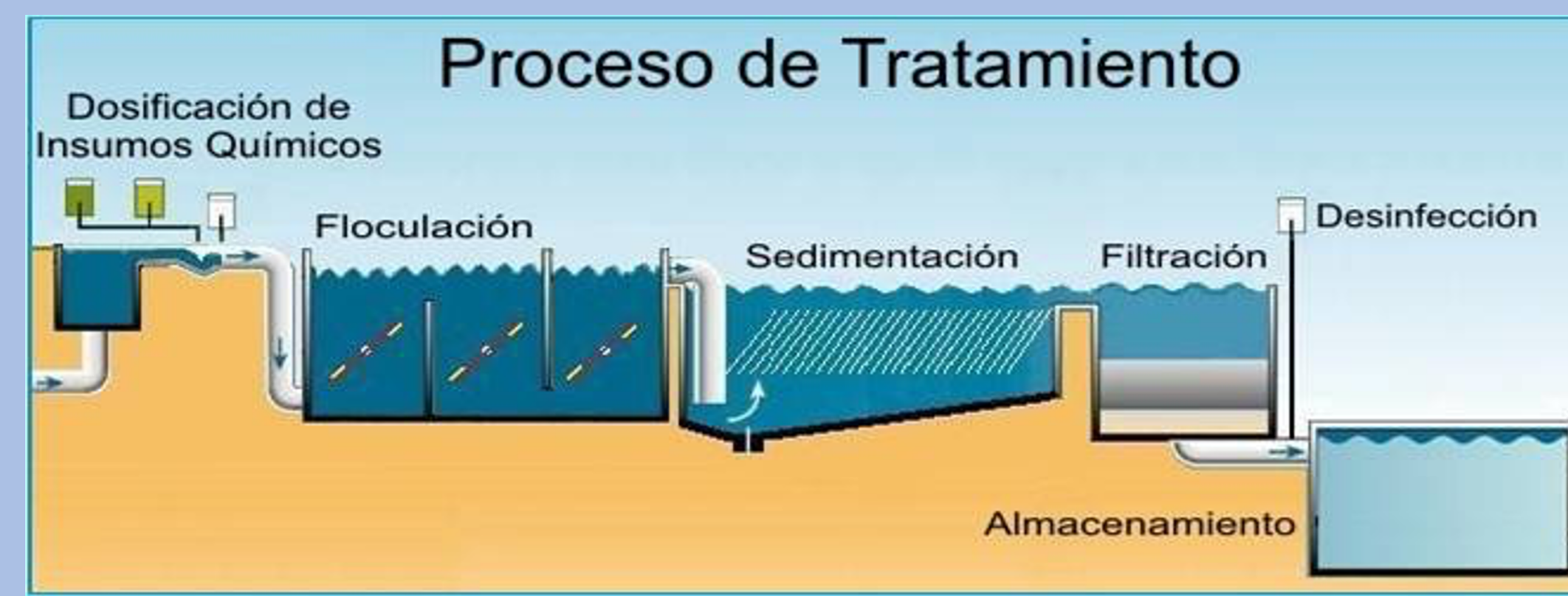
Figura 1 Proceso de tratamiento para producir agua potable [2]