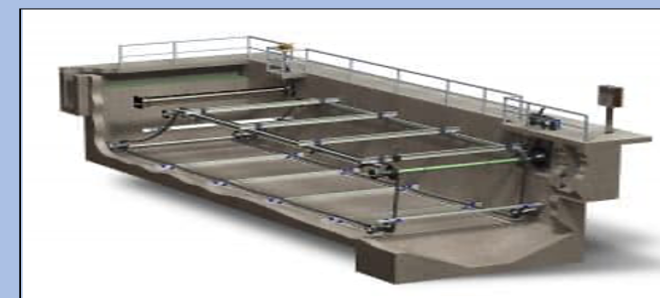
Figura 4 Sistema de remoción "scraper" (Water Online)

Para llevar a cabo la selección del sistema que se instalaría en la planta, se evaluaron los costos, tiempo de remoción, eficiencia de remoción y vida útil del sistema. La alternativa que resulto más costo efectivo para la corporación fue el sistema de remoción de lodo estilo "scraper". En la Figura 4 se presenta la alternativa seleccionada.