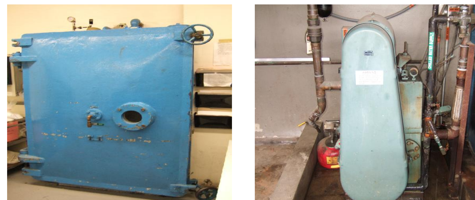
Fig 1. Cámara de Vacío Microvac

Para el alcance de los objetivos, el cual consta en validar el instrumento de Cámara de Vacío localizado en un área de empaque para inspecciones de sellado, se implementara un estudio de ingeniería como primera fase. El propósito del estudio de ingeniera es recopilar data y comparar los resultados de la prueba física de vacío antes y después de exponer lotes en botellas plásticas a un ciclo de la Cámara de Vacío MICROVAC, Figura 1.