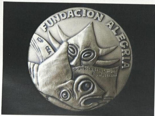
Medalla Fundación Ricardo Alegría 2010 dada al grupo Guajana por sus 50 años de gestoría poética.

Se precisa: pulcritud eficiencia puntualidad monogamia abstinencia virginidad episodios breves de beatitud rasgos delirantes de santidad. Se busca: pureza transparencia levedad. Se busca un poeta sin deudas ni pensiones sin atrasos en sus cuentas sin recargos por servicio. Se busca un poeta con su fondo de inversiones. Se busca máquina lírica que nos haga reír un poco sin nostalgia sin penas ni líos de entropierna y de ser posible sin espasmos sin filiación partidista sin política de orgasmos. Se abre plaza de empleo. Se busca un palabra-malabarista. Esta convocatoria no cierra hasta nuevo aviso. Repetimos: no será necesario tener latidos.