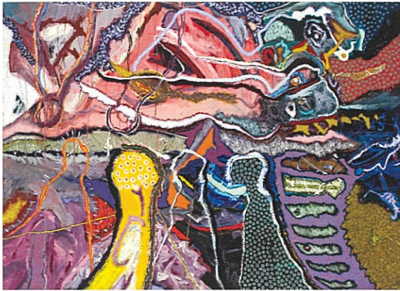
Orgía inducida , Cecilio Colón. Acrílico sobre lienzo. 1994