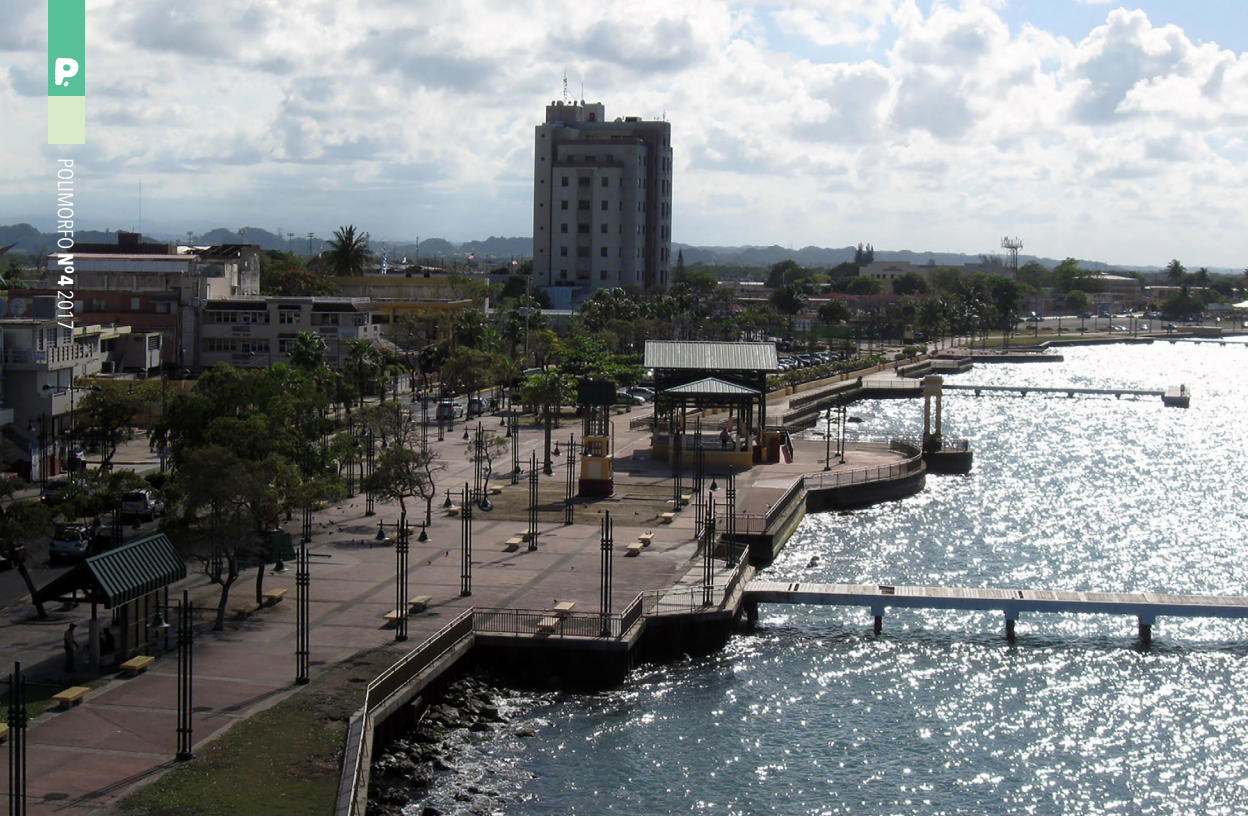
Imagen 1.1. Condición anterior del área central del Frente Marítimo de Cataño, en abril 2011. (Foto: Fernando Pabón Rico, FPR).

fueron eliminadas, aunque una fue reubicada en una parcela tierra adentro en el área conocida como La Puntilla. El extremo donde se solía ubicar esa cancha fue reconstruido como una plazoleta con una especie de obelisco en eje con el muelle. Hacia el centro del paseo se abrió una conexión peatonal con la plaza principal del pueblo y se construyó un pabellón. En el extremo occidental del paseo preexistente, se creó un paseo tablado elevado que permitiera la entrada a la villa pesquera ubicada en esa playa y conectara hasta la Pirámide. La villa pesquera también fue reconstruida. Todas las estructuras, pabellón, gazebos, obeliscos, villa pesquera, paradas de autobús, fueron diseñadas con una tectónica que respondió a las nociones del movimiento del Nuevo Urbanismo reconociendo el contexto histórico material de la arquitectura tradicional del pueblo (imágenes 1.1 a 1.2). El Nuevo Urbanismo es una perspectiva ampliamente reconocida que, además, pone en valor los métodos de producción arquitectónica local. El espacio público local refleja las costumbres de la gente durante una época; y es