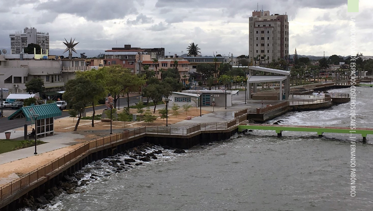
Imagen 1.2. Condición actual del área central del Frente Marítimo de Cataño, enero 2017.

to se equipó con una fuente seca (“chorritos”) y una pérgola. Más allá de los típicos cambios cosméticos implantados en este tipo de intervenciones, aquí representados principalmente por un pavimento de hormigón que sustituyó las baldosas, la proporción de espacio ‘natural’ aumentó en el frente marítimo. Áreas que antes estaban convencionalmente pavimentadas, fueron cubiertas de césped, arenón y viruta de madera y se densificó la vegetación, algo que para la arquitecta paisajista Tamara Orozco “siempre es un reto local”. Este vínculo más estrecho con el paisaje y el ecosistema fue reforzado por: un itinerario de ciclismo acompañado de áreas de descanso; la apertura de vistas mediante la sustitución de los barandales por otros, diáfanos; y más significativamente que nada, la renuncia a una porción del tablado que era reclamado por la arena depositada por el oleaje (imagen 2). El caso de Cataño es tal vez el que mejor refleja eso de aprovechar la oportunidad que supuso la iniciativa por poner al día, dentro de métricas difundidas globalmente, el espacio público local. Mientras este tipo