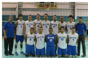
Equipo de Voleibol Masculino PUPR