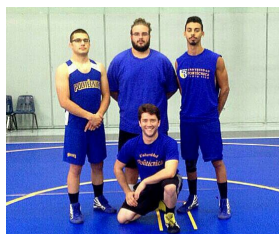
Equipo de Lucha Olímpica