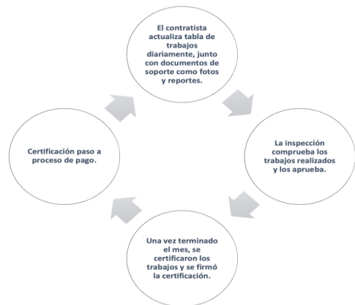
Figura 1 Proceso para cierre de certificaciones mensuales

Este trabajo de investigación fue tipo descriptivo-cuantitativo. Para el éxito de la optimización de las certificaciones en los meses de abril y mayo, antes del comienzo del periodo del proyecto, se creó un canal en el programa Microsoft Teams, donde se localizaron las partidas de los trabajos, junto con los costos de las partidas y sus cantidades. Se recopilaron los procesos para cierre de certificaciones de los trabajos mensuales en el proyecto de construcción. La Figura 1 muestra el proceso que se estableció para cierre de certificaciones mensuales.