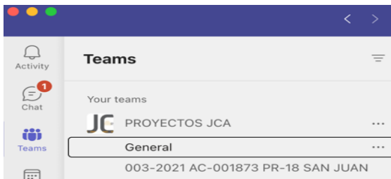
Figura 2 Enlace Microsoft Teams Proyecto Carretera PR-18

El método que se utilizó para la recopilación de datos fue la observación y recolección de documentos. La información fue recopilada por empleados y supervisores de diferentes áreas del proyecto en la carretera PR-18 en el Municipio de San Juan. En la Figura 2 muestra el enlace de Microsoft Teams creado en la investigación y compartido con el personal que incluyeron ingenieros, supervisores, inspectores y personal de administración del proyecto de la Autoridad de Carreteras que a su vez tenían acceso a los cambios diarios realizados en la tabla de trabajos.