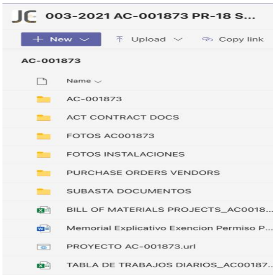
Figura 3 Documentos compartidos proyecto carretera PR-18 Microsoft Teams

La Figura 3 muestra los documentos recolectados que incluyeron fotos, compras, recibos, reportes diarios de los trabajos realizados por las brigadas del proyecto en el enlace creado en Microsoft Teams.