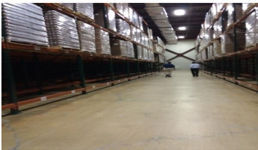
Figura 4 Facilidades de César Castillo