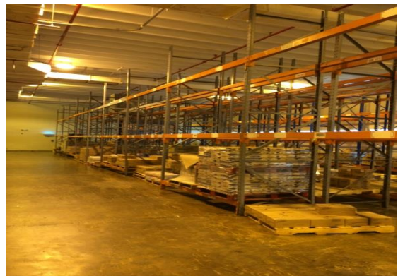
Figura 2 Localizaciones parcialmente vacías