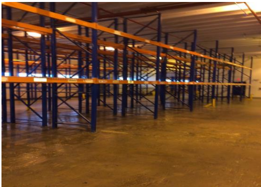
Figura 3 Almacén de Abbott finalizado

Una vez se completó el movimiento de la mercancía al almacén de Castillo, se procedió a entregar las facilidades e inspección de la misma. La Figura 3 ilustra cómo quedó el almacén una vez inspeccionado y acondicionado para entrega. Oficialmente se comenzó la operación en el nuevo almacén y se comenzó al proceso de despacho de órdenes, recibo de productos, acomodo en localizaciones, entre otros. La Figura 4 muestra el almacén de César Castillo, una vez se comenzó la operación.