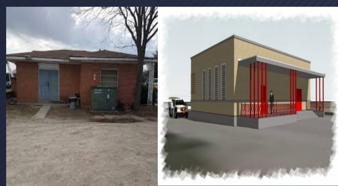
Figura 1 Estación de Bombeo Existente vs. Propuesta

La compañía de construcción Webber LLC lleva a cabo la renovación de las instalaciones de Walcrest. El contrato inicial del proyecto de construcción entre la ciudad de Dallas y Webber LLC fue de $36,700,000 y, debido a órdenes de cambios, el contrato actual es de $37,410,000. El problema con el que se encuentra la compañía de construcción Webber actualmente consiste en que, según la revisión de presupuesto realizada en agosto del 2017, se proyectó una pérdida de $4.6 millones de dólares al finalizar la renovación de Walcrest. Por lo que se tiene como objetivo el implementar alternativas para reducir en un 15% la pérdida proyectada en la revisión de presupuesto del 2017.