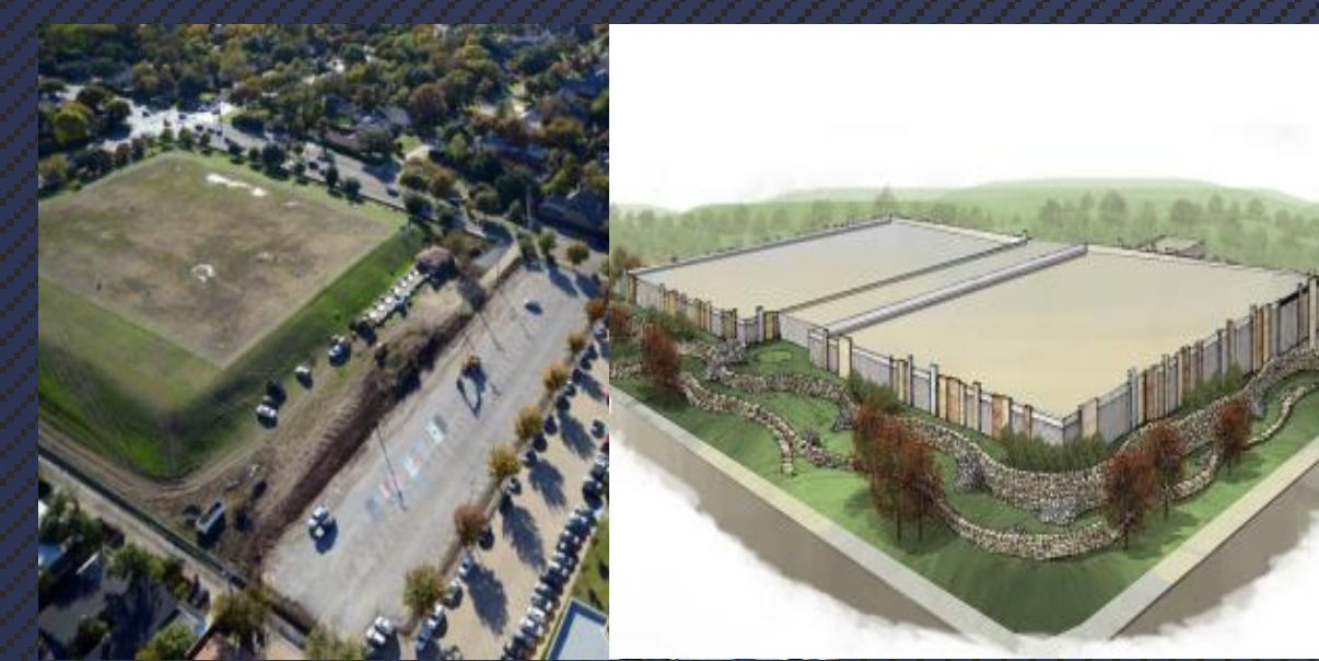
Figura 2 Tanque de Reserva Existente vs. Propuesta