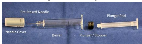
Figura 1 Componentes de la Jeringuilla