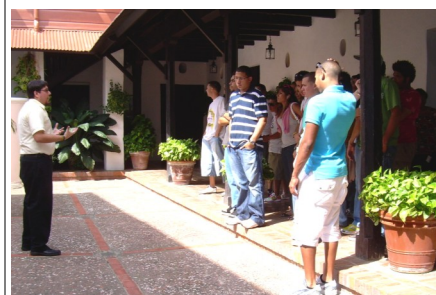
Estudiantes de la Poli, escuchan atentamente al guía, durante la visita al museo Casa Alonso

El viernes 25 de abril, los estudiantes de la Universidad Politécnica, tuvieron la oportunidad de visitar el Museo Casa Alonso , en el pueblo de Vega Baja.