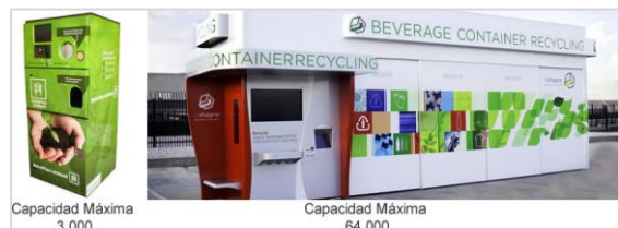
Figura 3 Máquinas que componen el sistema Eco-Premia

Implementando el sistema de Eco-Premia en Puerto Rico, en la Figura 3 se muestran los resultados obtenidos para el año presente 2015. Estos resultados fueron producto de acuerdo a las estadísticas de la proyección realizada utilizando las estadísticas de la Autoridad de Desperdicios Sólidos de Puerto Rico. La Figura 3 muestra las máquinas tipo ATM que se compone el sistema completo de Eco-Premia. El sistema está compuesto por dos máquinas con una capacidad máxima de 3,000 envases vacíos por cada municipio y ocho estaciones en cada región con una capacidad máxima de 664,000 envases vacíos.