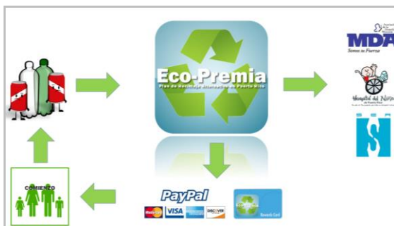
Figura 2 Flujograma del funcionamiento de Eco-Premia

Eco-Premia, además de ser un plan complementario donde ayuda a aumentar los recaudos, promueve el reciclaje de una manera más interactiva ya que estimula a las personas a que reciclen estos materiales debido a que está diseñado para recompensar a la persona una vez la persona deposite los materiales. Para propósitos de una visión más clara, se realizó un flujograma que se muestra en la Figura 2.