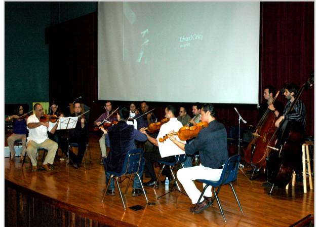
La orquesta ejecutando una de las piezas musicales