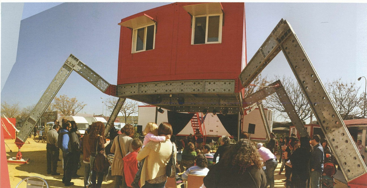
Fig.1. Aula Abierta. Foto por Juan Gabriel Pelegrina. Fig.2-4. Espacio Artístico - La Carpa