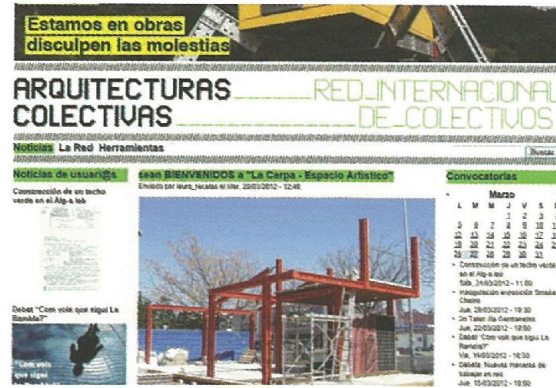
Fig. 6. www.colectivosenlared.org www.arquitecturascolectivas.net http://www.meipi.org/reddaacc.meipi.php