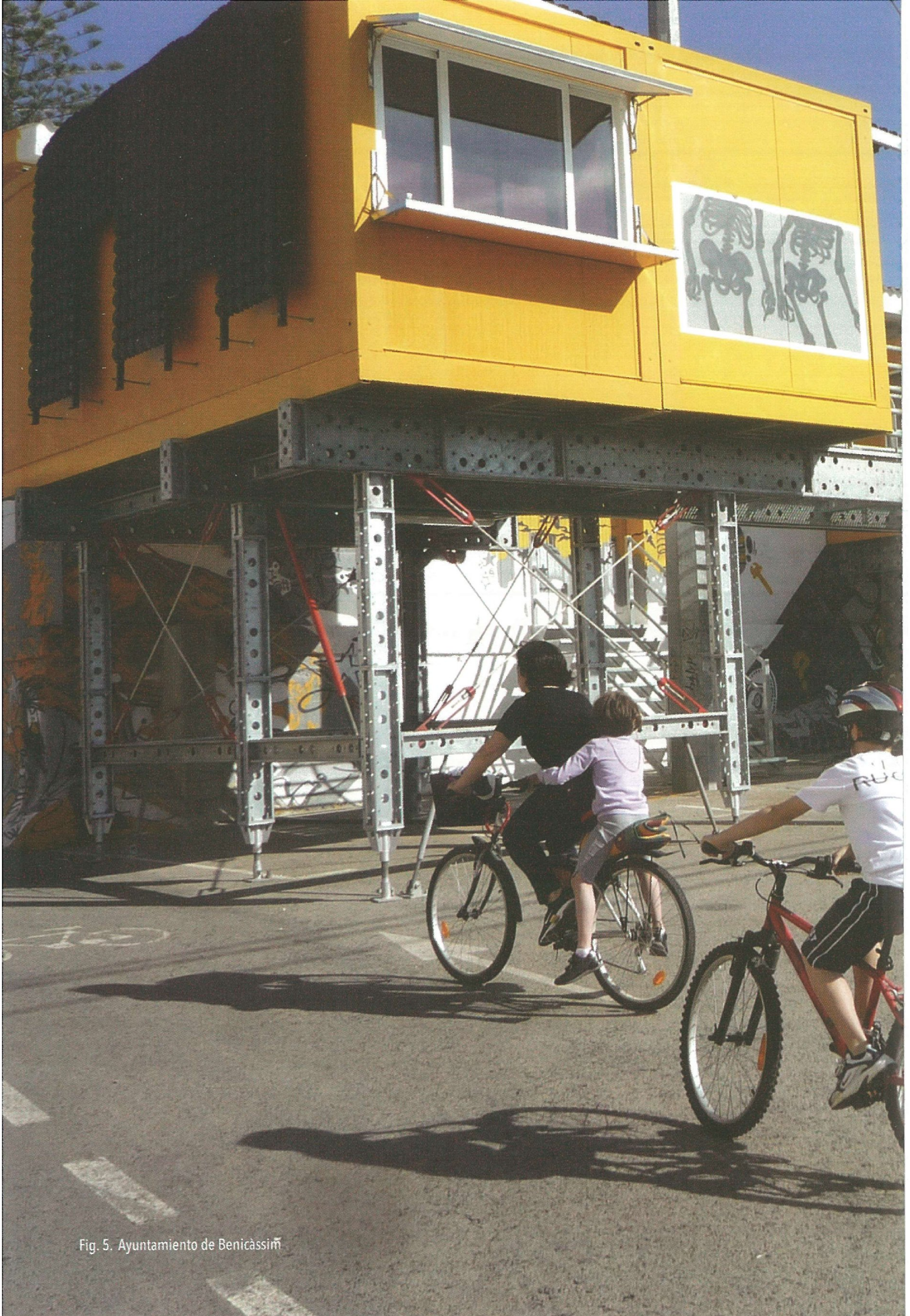
Fig. 5. Ayuntamiento de Benicàssim