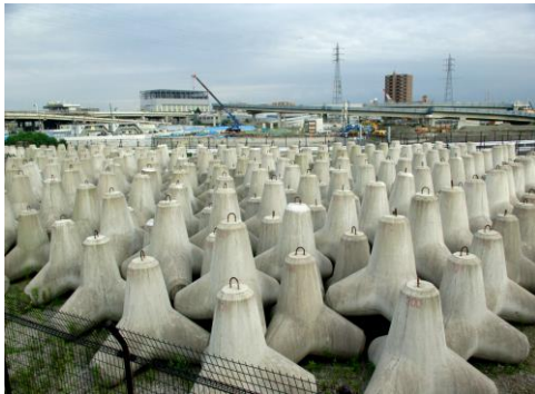
Figura 7 Fabricación de Dolos

Ocurre la misma situación con la colocación de dolos en la región de altamar por la importancia arqueológica en la costa. Los dolos son excelentes estructuras para disipar la energía de las olas. Son excelente herramienta para estudiar el movimiento de las olas debido a que pueden ser estudiados de acuerdo con cómo se acomodan con el movimiento de la marea. Tienen un bajo costo de producción. Son extremadamente pesados por lo que deben ser fabricados en un área cercana a su instalación. La Figura 7 se puede apreciar el gran tamaño que estas estructuras podrían adquirir. Esto imposibilita el área de impacto ya que tendrían que ser transportados por buques y colocados con maquinaria pesada. El costo aproximado para la construcción de un dolo es de $4,000. Se tendría que evaluar nuevamente la profundidad en la cual serían colocados y la longitud de la zona que se pretende cubrir.