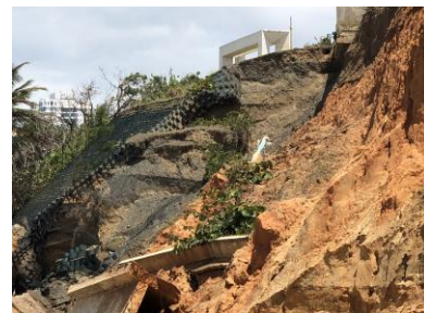
Figura 1 Estado Actual en el Paseo Lineal

En la Figura 1 se puede apreciar dos tipos de sedimentos encontrados. El de la izquierda fue introducido como método para el control de erosión a través de geo-muros el cual es un sistema de contención de tierra estabilizada mecánicamente. A la derecha se puede ver el terreno natural encontrado en la región.