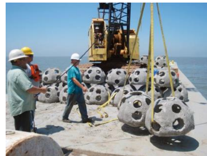
Figura 6 Instalación de Arrecife Artificial

En la Figura 6 se puede ver el proceso de instalación de los arrecifes artificiales. En el estudio de caso se tendría que utilizar una barcaza para el transporte de los arrecifes artificiales y colocarlos en altamar.