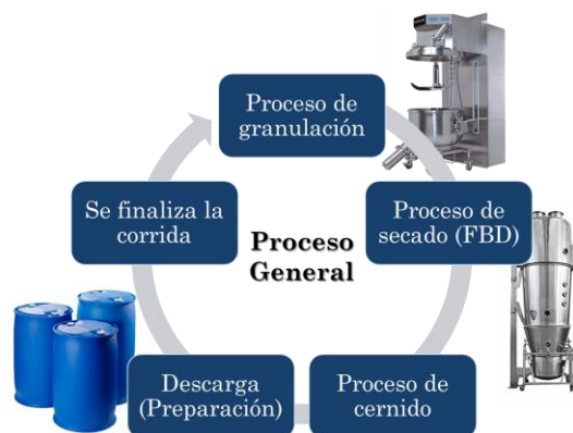
Figura 1 Proceso de granulación

de mantenimiento del equipo y de mano de obra. Entre los problemas identificados, se encontró que había intervenciones frecuentes sin sincronizar del equipo debido a los Mantenimientos Preventivos (PM, por sus siglas en inglés), causando la inactividad del equipo con mayor frecuencia. Además, se identificaron tareas que no añaden valor al equipo y tareas repetidas entre un PM y otro.