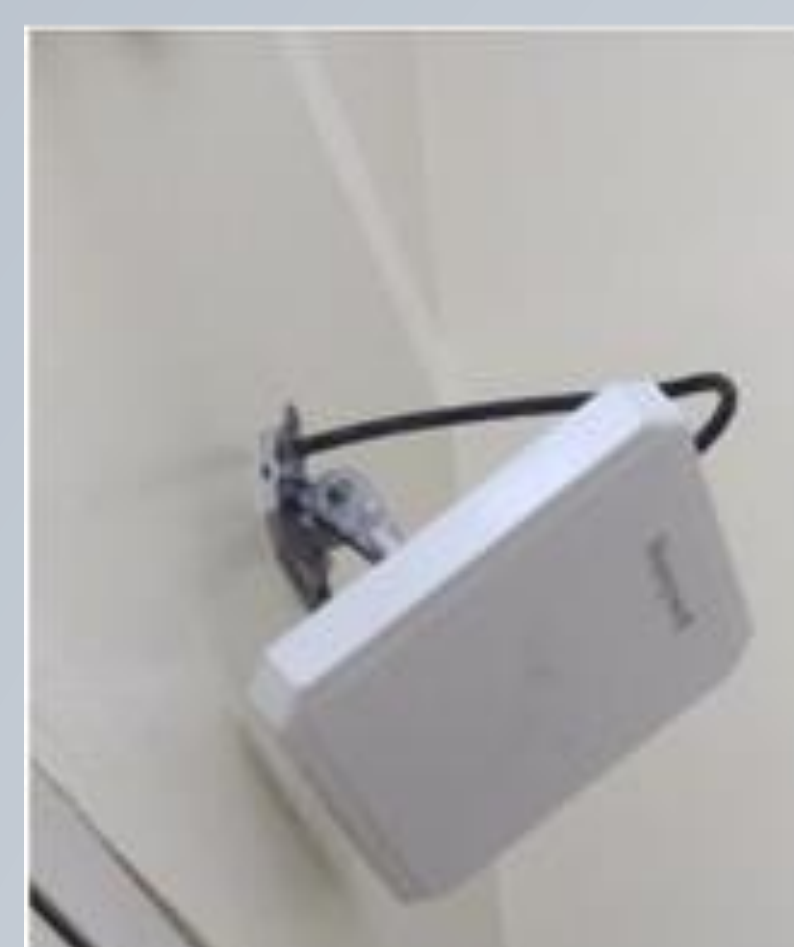
Figura 1. Instalación de antenas en los almacenes