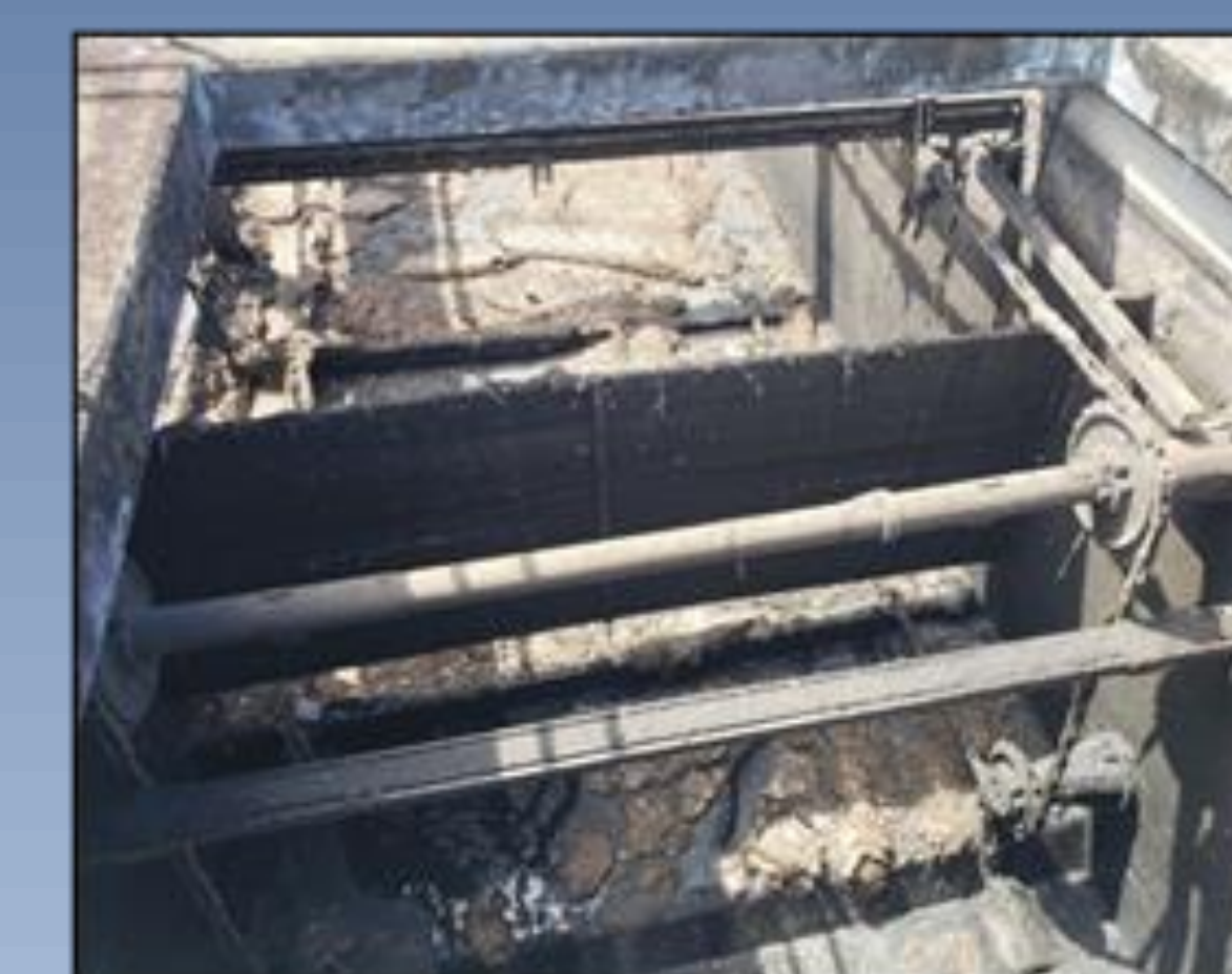
Figura 3 Acumulación de arena en clarificador primario PAS Puerto Nuevo