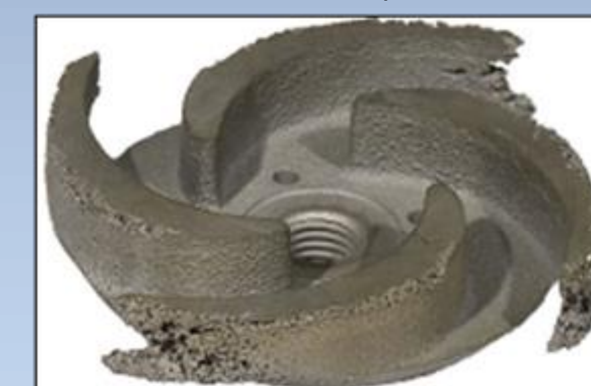
Figura 4 Efecto de abrasión en bomba centrífuga