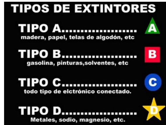
Figura 5 Tipos de Extintores y sus Funciones

Excavaciones - Las excavaciones deben realizarse en un suelo estable. Un ingeniero licenciado debe realizar el diseño, autorizar y supervisar los trabajos de excavación. El sistema de protección utilizado debe resistir sin fallar todas las cargas que se intentan proteger.