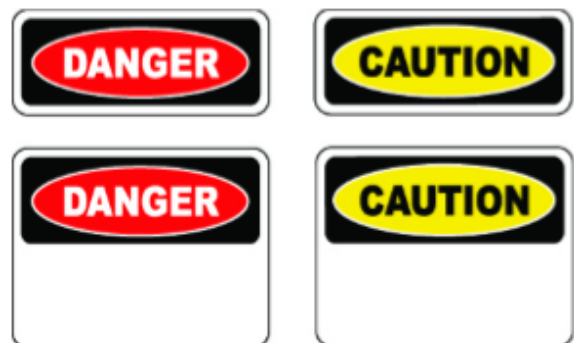
Figura 2 Letreros de Cuidado y Peligro

Letreros – hay dos tipos de letreros más comunes utilizados en la construcción: peligro, deben ser usados para alertar los peligros inminentes con color rojo en la parte superior y blanco en la inferior y cuidado, para alertar riesgos potenciales o prácticas peligrosas con color amarillo y negro.