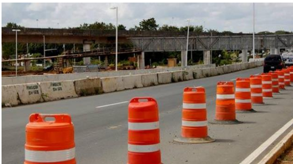
Figura 3 Barricadas de Seguridad en la Carretera

Barricadas - Estructuras temporeras que proveen disuasión al paso de individuos o vehículos. Deben de ser en materiales que no puedan ser fácilmente removidos. Comúnmente vemos en la carretera los conos anaranjados para identificar las áreas de construcción.