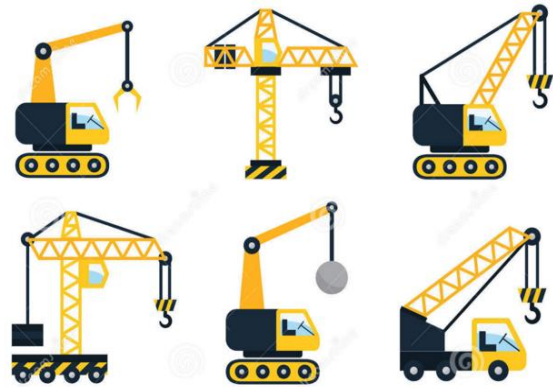
Figura 4 Grúas

Grúas - El operador debe cumplir con las especificaciones del fabricante y nunca exceder los límites de la grúa. En caso de que no se tengan las especificaciones, los límites del equipo se deben determinar por un ingeniero con experiencia en el campo de trabajo. El operador debe recibir instrucciones de una sola persona, esto es para evitar confusiones. Se deben realizar inspecciones diarias para determinar el buen funcionamiento de la grúa.