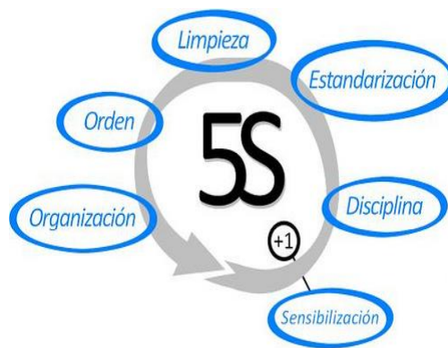
Figura 2 Flujo de la Metodología 5S

En la siguiente Figura 2 se muestra el flujo de la metodología 5S utilizada para mejorar las condiciones de trabajo en la Farmacia Romero: