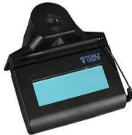
Figura 3 Dispositivo para Realizar la Firma Electrónica

ya que la mayoría de estos son personas de edad avanzada y consumen muchos medicamentos por las diferentes condiciones a las que padecen. Con esta firma, se confirma que el paciente recogió los medicamentos. En caso de que el paciente no pase a recoger su medicamento, esa etiqueta no será firmada, por lo que el plan no pagara el costo del medicamento. Adicionalmente, si en la etiqueta y en la prescripción médica del paciente no aparece la información solicitada por el plan médico en la auditoria, la aseguradora no pagara el medicamento o servicio brindado al paciente.