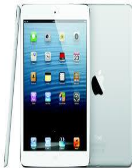
Figura 4 Equipo Necesario para Realizar las Entregas al Hogar